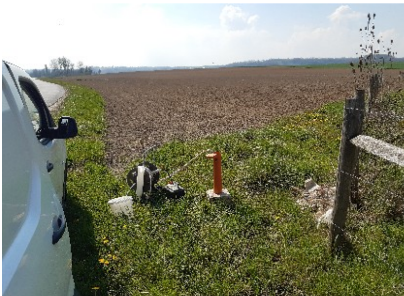
Photo du point de prélèvement